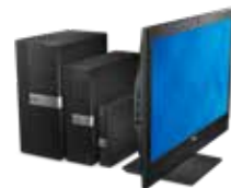
• Client Hardware (OptiPlex, Latitude or Vostro)

Si vous estimez que le bonus d'accueil n'est pas suffisant, vous pouvez continuer à gagner des points en achetant les produits Dell EMC suivants dans le cadre du Loyalty Program for Authorized Partners :