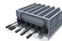
• Docks and Carts