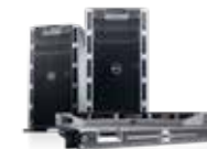
• PowerEdge Servers