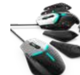
• Client Peripherals